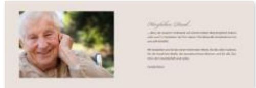
Trauerkarte „Am Steg“